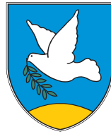
Občina · Comune di IZOLA · ISOLA